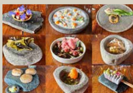
南美洲 50 佳餐廳 Gustu