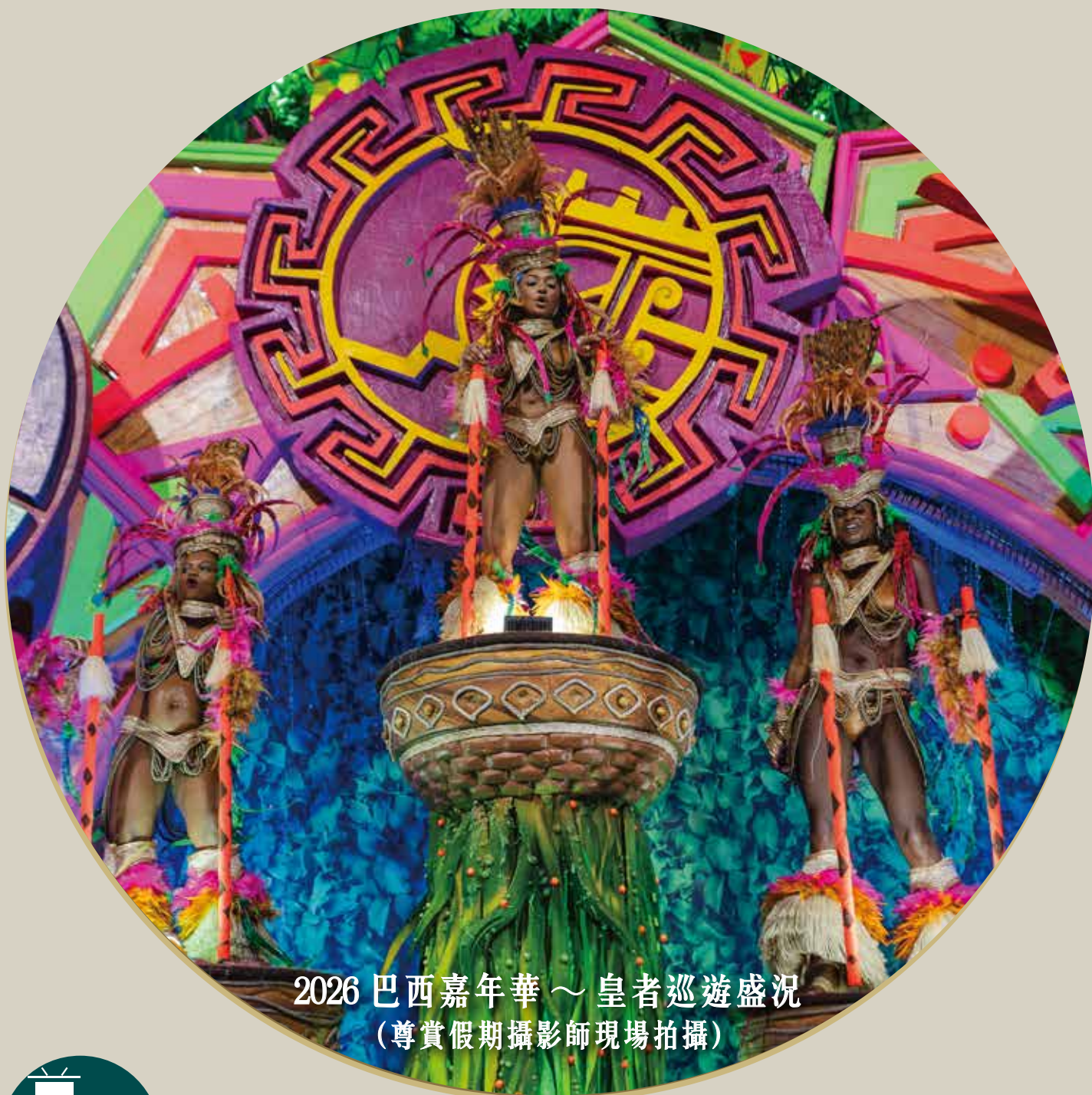
2026 巴西嘉年華 ~ 皇者巡遊盛況