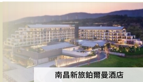
南昌新旅鉅爾曼酒店