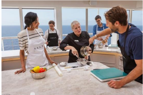
S.A.L.T. Lab SALT 實驗室