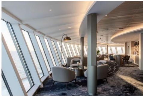
Observation Lounge 觀景休息室