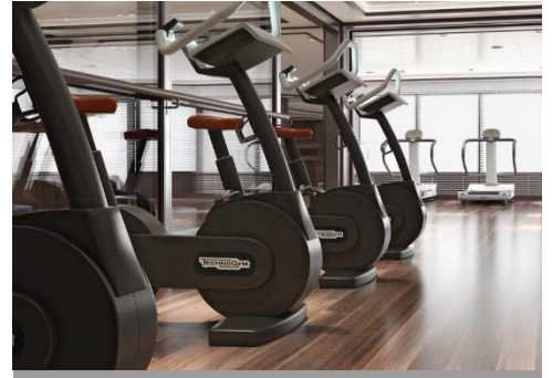
Fitness Centre 健身室