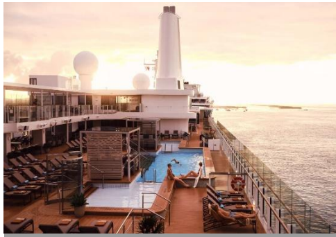
Pool Deck 泳池甲板