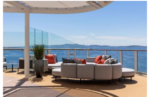
The Dusk Bar 黃昏酒吧