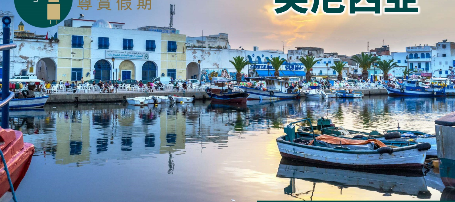
比塞大 - 舊港口