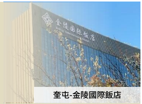
奎屯-金陵國際飯店