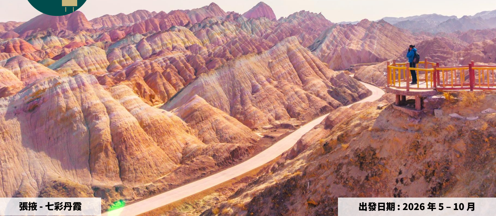
張掖 - 七彩丹霞