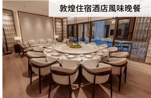
敦煌住宿酒店風味晚餐