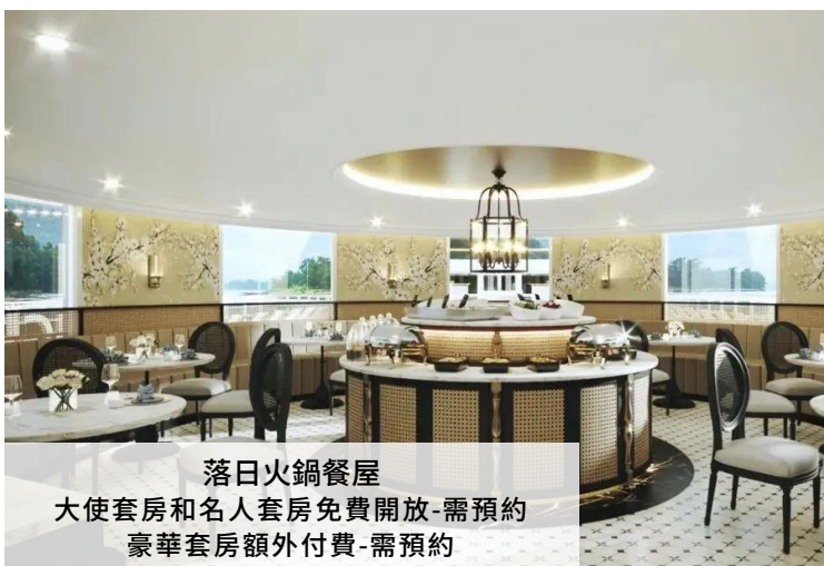
落日火鍋餐屋 大使套房和名人套房免費開放-需預約 豪華套房額外付費-需預約