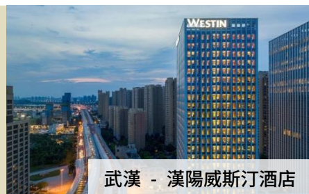
武漢 - 漢陽威斯汀酒店