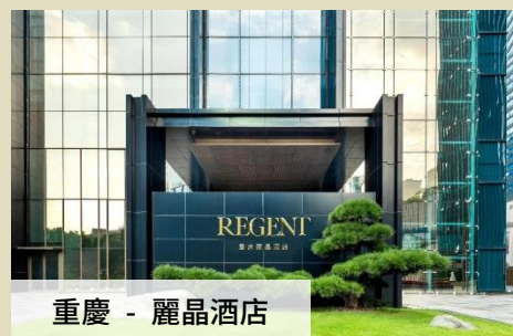
重慶 - 麗晶酒店