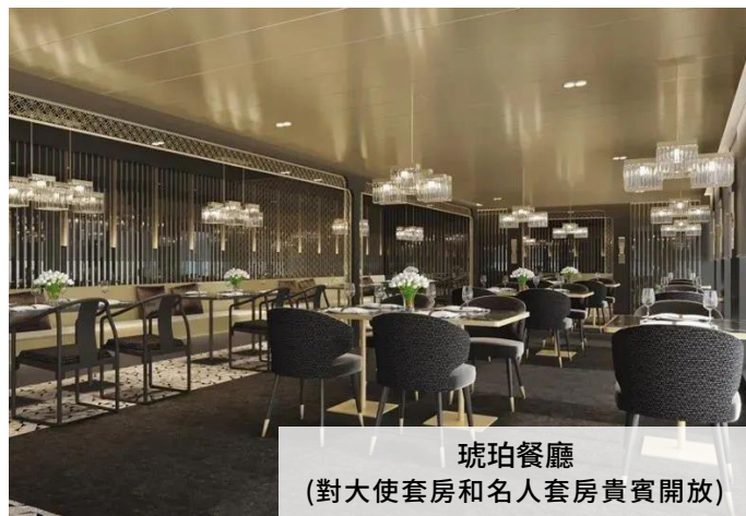
琥珀餐廳 (對大使套房和名人套房貴賓開放)