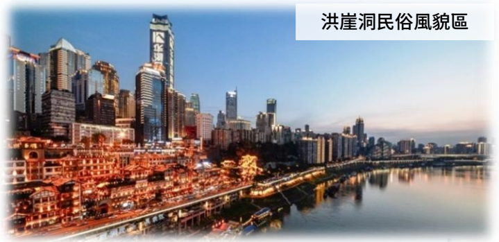
洪崖洞民俗風貌區