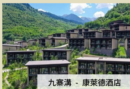
九寨溝 - 康萊德酒店