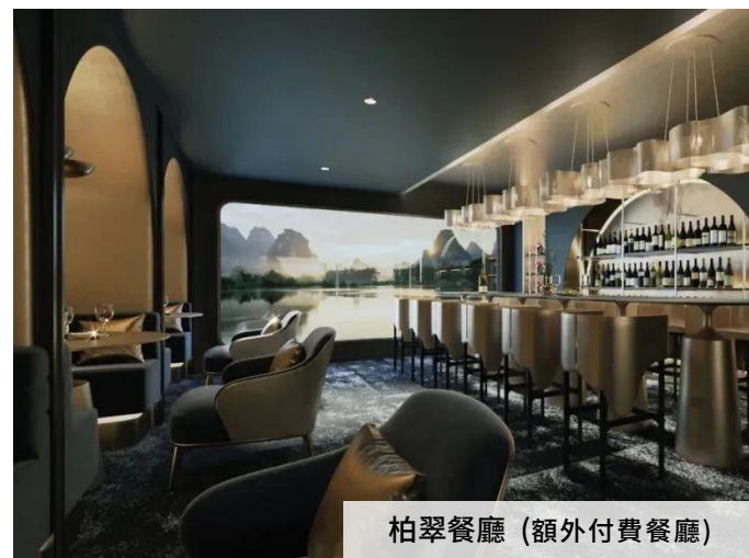
柏翠餐廳 (額外付費餐廳)