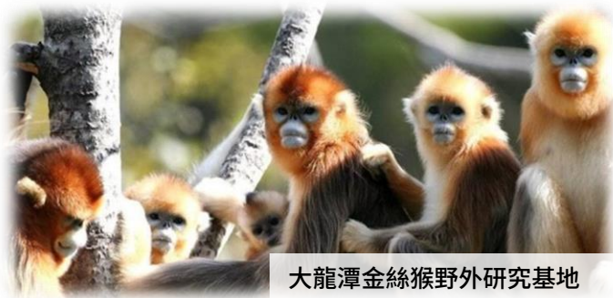
大龍潭金絲猴野外研究基地