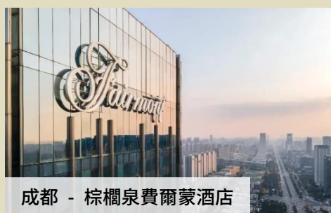
成都 - 棕櫚泉費爾蒙酒店