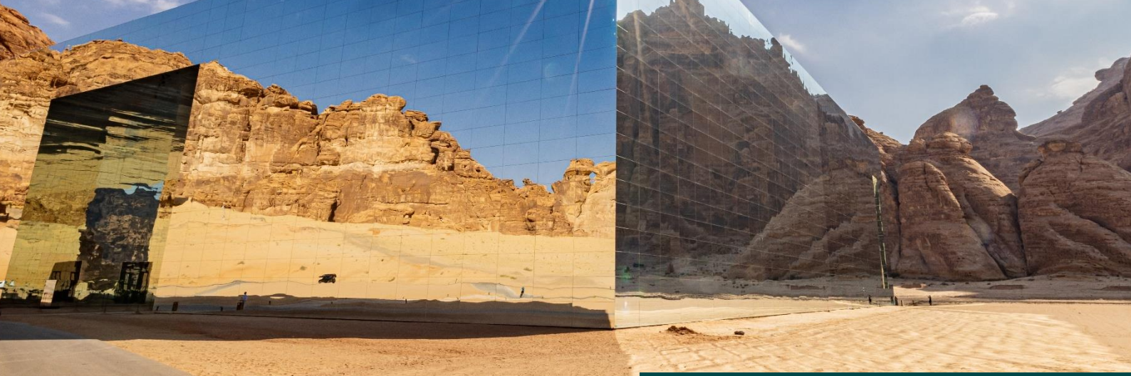
埃爾奧拉 - 馬拉亞音樂廳